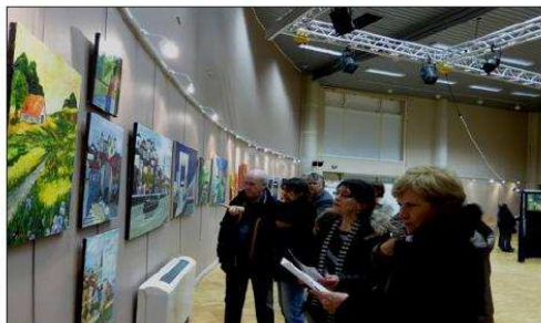
■ Une exposition est toujours un moment fort pour les artistes.

La 21 e exposition de l'Atelier peindre à Sainte-Foy débute ce vendredi. La toile lumineuse, qui lance cette édition, est intrigante. « Nous avons eu le coup de cœur pour cette toile où tous les adhérents, en fin de cours, viennent essayer leurs pincesaux, explique Bridge, présidente de l'Atelier peindre à Sainte-Foy. Elle résume visuellement et avec un peu d'humour les toiles de deux ans d'ateliers que nous exposons. » Cette école est devenue associative en 1986 et a pris son nom actuel. « Ce côté associatif, nous y tenons, souligne la présidente. C'est la chaleur de l'accueil qui prime, on vient parce qu'on se sent bien, sinon on va prendre des cours privés. »